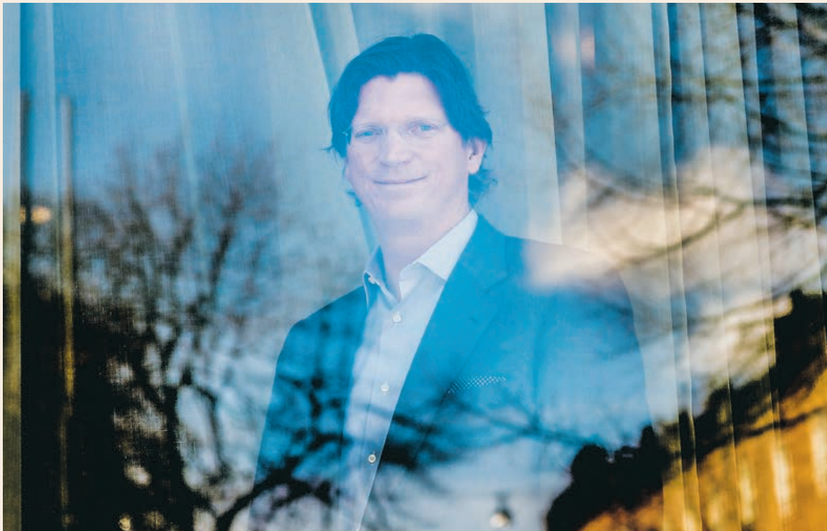
Skypegrundaren Niklas Zennström ser innovativ miljöteknik och ett klimatvänligt näringsliv som ett måste inom en snar framtid.

Midway meddelar att i samband med försäljningen av Sävsjö Trähus har misstanke om oegentligheter uppstått i Sävsjö. Utredning pågår och vd för Sävsjö Trähus har lämnat sin befattning med omedelbar verkan. Försäljningen av bolaget har avbrutits och den bolagsstämma som skulle hållits den 26 september är inställd, skriver Direkt.