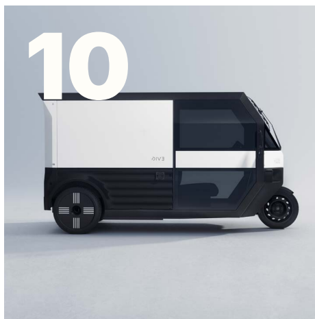
Marknaden och verksamheten