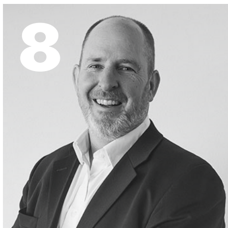
VD har ordet